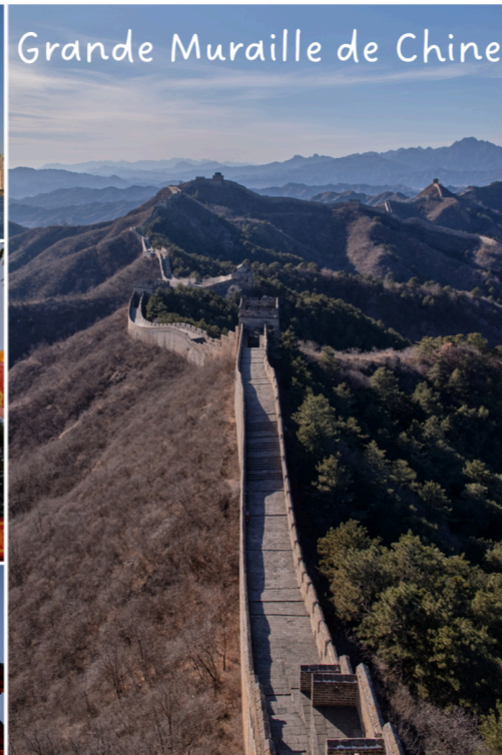
Grande Muraille de Chine